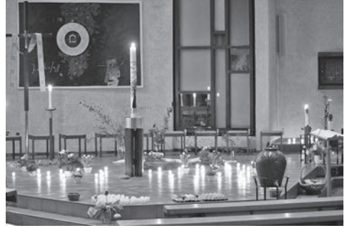
Osternacht: Eine Kirche voller Frühling, Leben, Erwachen, Musik und mitten drin das Licht der Befreiung.