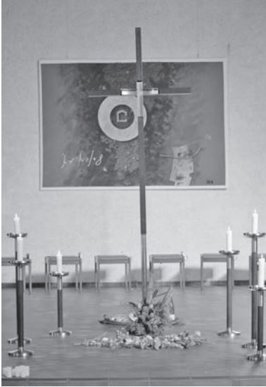
Karfreitag: Das aufgerichtete Kreuz. Menschen kamen vorbei und haben Blumen oder Zweige abgelegt.