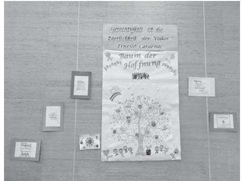
Installation «Baum der Hoffnung» im Zentrum Dreikönig: Male ein Bild oder schreibe etwas dazu!

In dieser schwierigen Zeit möchten wir die Gemeinschaft stärken und Hoffnung schenken. Lasst uns zusammen einen Baum der Hoffnung im Saal vom Pfarrei- und Begegnungszentrum Dreikönig gestalten. Jede/r darf mitmachen.