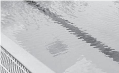
Fest installiertes Schwimmbecken

Das vorliegende Merkblatt richtet sich an Inhaber von privaten Schwimmbecken und von mobil aufstellbaren Pools. Gezeigt sind die Grundsätze zum umweltgerechten Umgang mit Becken-, Pool- und Reinigungswasser.