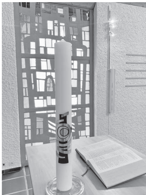
Unser Osterlicht in der Kirche Füllinsdorf