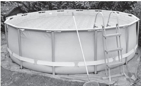
Mobil aufstellbarer Pool im Garten

Die Füllung hat bis Ende Mai zu erfolgen.