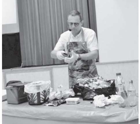
Am Ende gab es noch verschiedene Fragen aus dem Publikum, welche von den Referenten beantwortet wurden.