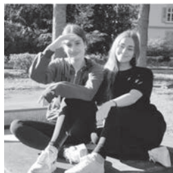
Ein Zeitungsbericht von Elma Miftari und Erza Heta.

Viele andere Lehrpersonen und Schüler fanden es ebenfalls eine grossartige Idee von uns und würden gerne auch mehr zur Biodiversität beitragen.