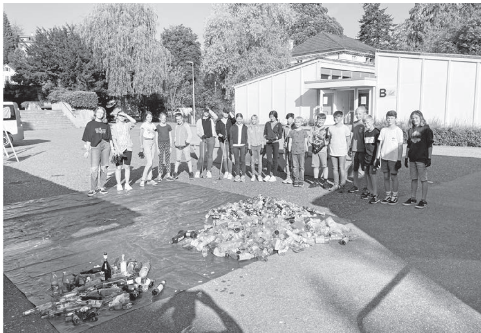
Die 1Pf beim Müllsortieren