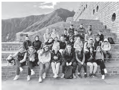
Ausflug zur Bottakirche auf dem Monte Tamaro