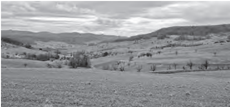
Blick von Junkerschloss Richtung Hemmiken, Gelterkinden u. Jura