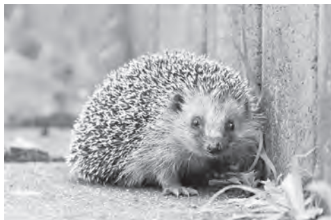
Igel an einer Gartenmauer

Die OrganisatorInnen freuen sich über zahlreiche positive Rückmeldungen!