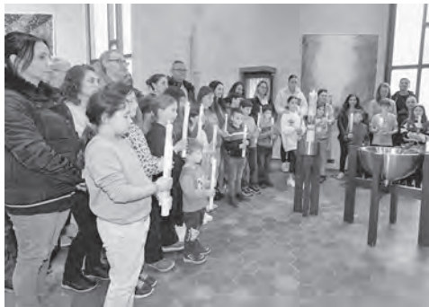
Erstkommunionvorbereitung – Tauferneuerung